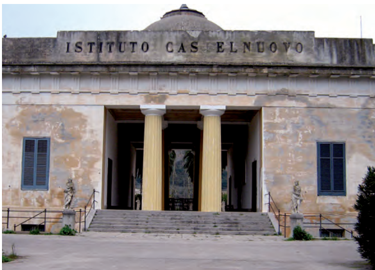
Antonino Gentile, Gymnasium dell'Istituto Agrario di Villa Castelnuovo, 1830-34