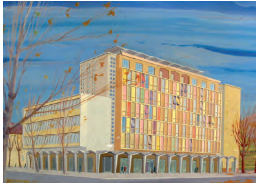
Borgo rurale a Dagala Fonda, la chiesa e la canonica