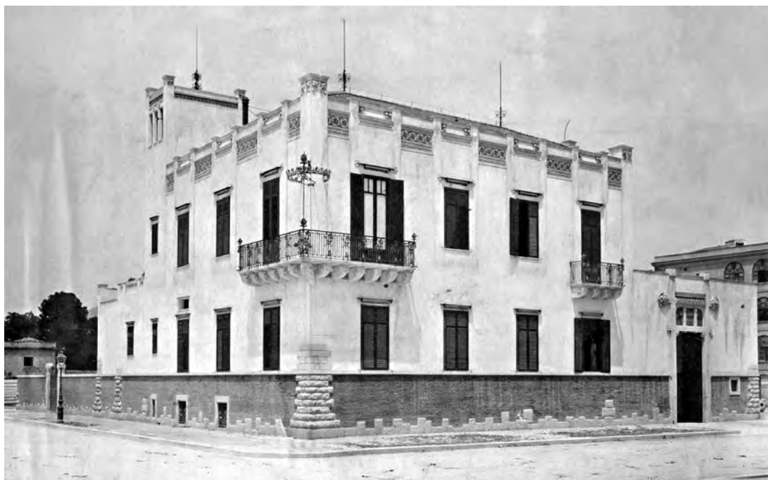
La casa - studio in una foto d'angolo tra le vie Siracusa e Villafranca

Schizzo del vestibolo d'ingresso (da G. Pirrone, Studi e schizzi di Ernesto Basile , Sellerio editore Palermo 1976)