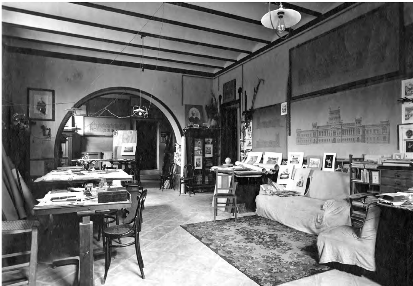
Lo studio dell'architetto

Sala da pranzo, con il tavolo e le sedie "tipo crostacei" realizzati da Ducrot