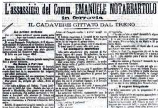
La notizia dell'assassinio pubblicata sul Giornale di Sicilia

13 dicembre: si svolge un'affollatissima assemblea di tutti gli aderenti alle onoranze cittadine durante la quale il presidente del