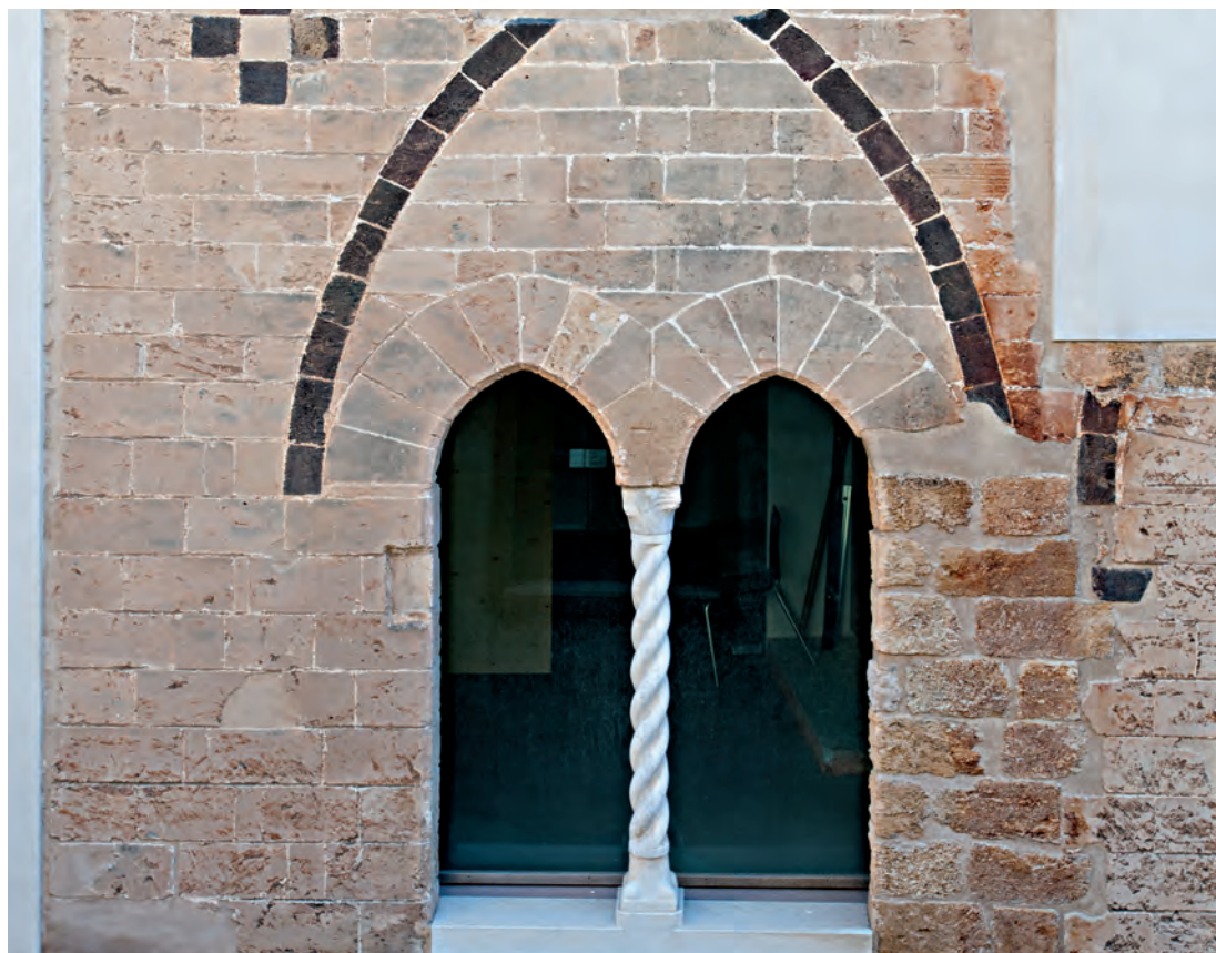
Palazzo Castrone Bifora nel Vicolo dello Zingaro

spazio ad angolo della Galca. Sul fronte Sud si apriva uno degli ingressi del palazzo Sclafani e, al piano nobile, una fila di finestre sormontate da archi intrecciati per una lunghezza di 50 metri. Alla fine del Trecento Matteo Carastono aveva occupato abusivamente e trasformato in trappeto da zucchero il bagno pubblico del palazzo Sclafani e nel 1407 il Pretore gli aveva ingiunto di restaurarlo 11 .