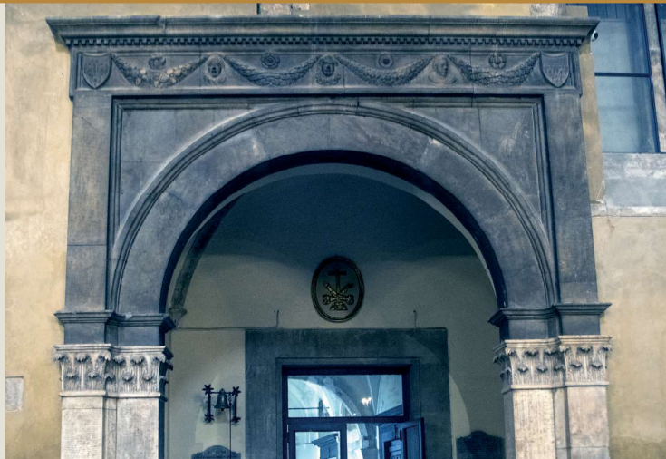
Arco della cappella della famiglia Campo (prima del restauro)