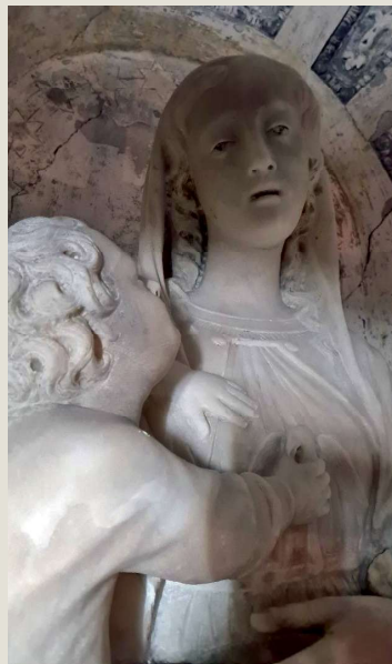
Madonna col Bambino, particolare (durante il restauro)