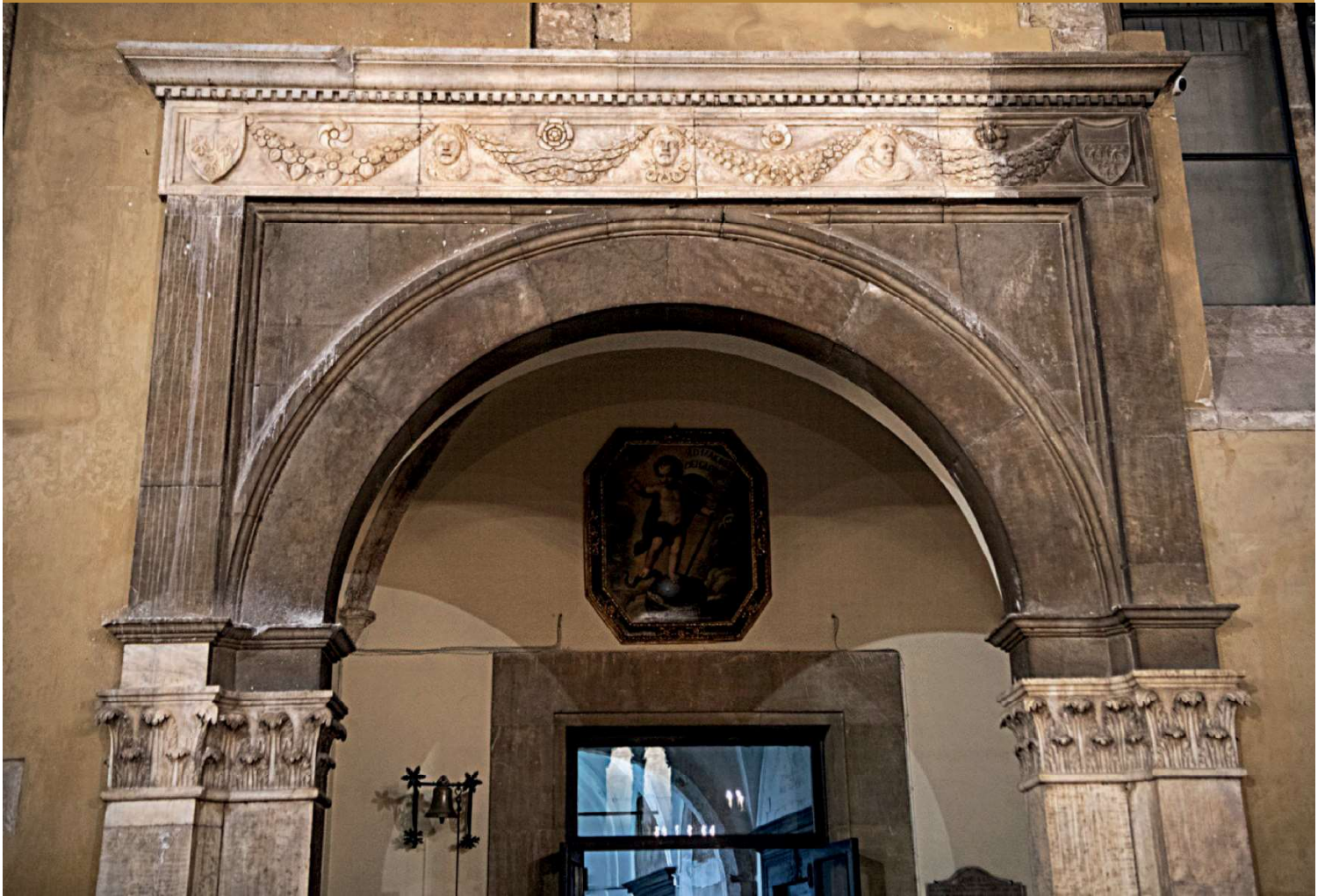
Arco della cappella della famiglia Campo (durante il restauro)

Silvana Lo Giudice - Coordinatore della Commissione Restauri