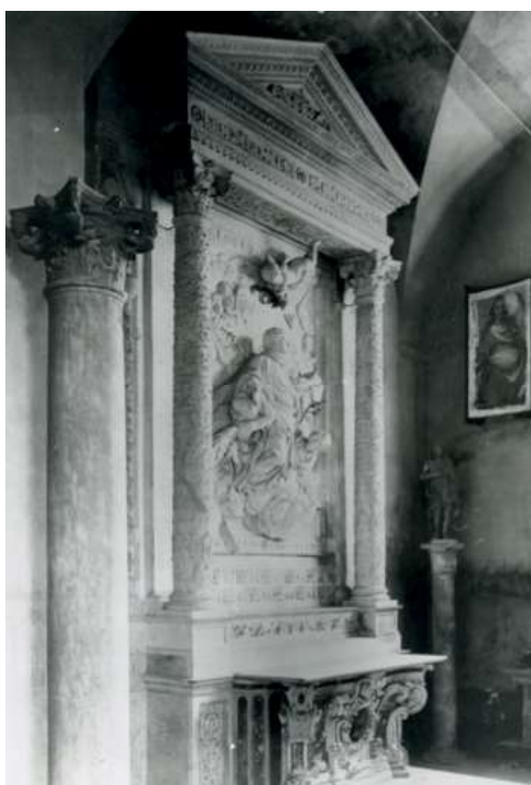
Altare del Gagini al Museo Nazionale (primi del '900)

Allora insegnavo Storia dell'arte al Liceo Classico vicino alla Cattedrale e alla Soprintendenza ai Monumenti in via Incoronazione, dove trascorrevi ogni ora libera in quella piccola biblioteca, per consultare libri e riviste. In un ambiente seminterrato era l'archivio fotografico, che un giorno decisi di esplorare: era deserto e poco illuminato. Le notizie allora raccolte sull'altare del Gagini datavano tra '700 e '800 (Antonino Mongitore, Gioacchino Di Marzo, Gaspare Palermo). Esistevano descrizioni della struttura marmorea ma niente immagini: troppo poco per identificarlo. Sapendo che nel sec. XVIII l'altare, dopo lo Spasimo e la chiesa di Santo Spirito (dal 1572), era stato trasferito nella chiesa gesuitica di Santa Maria della Grotta, cercai nell'archivio fotografico della Soprintendenza la cartella relativa dove trovai l'altare del Gagini. Con quell'inedito tesoro in mano chiesi una copia della foto che ebbi in pochi giorni. La ricerca stava prendendo la giusta via,