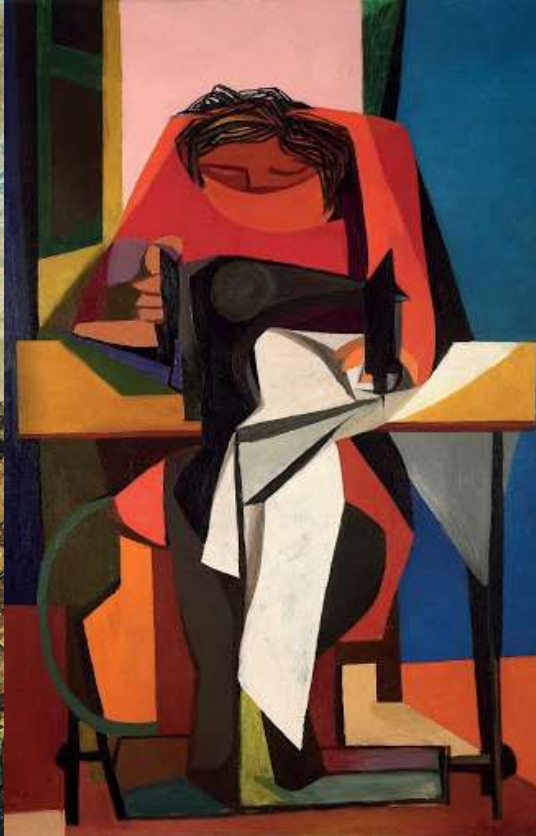
Renato Guttuso - La cucitrice (1947)