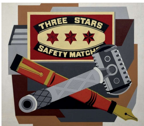
Gerald-Murphy - Razor (1924)

È successo e succede in tutti i campi influenzati dall'arbitrio umano. A tal fine, per gioco, voglio immaginare un mondo in cui i testi di storia dell'arte vengano periodicamente- diciamo ogni dieci anni- bruciati (sogni di gioventù rimossi?), per essere riscritti da altri "esperti"; magari di "nuova generazione", portatori dei problemi che agitano la nostra contemporaneità, con altre esperienze ed altri curricula.