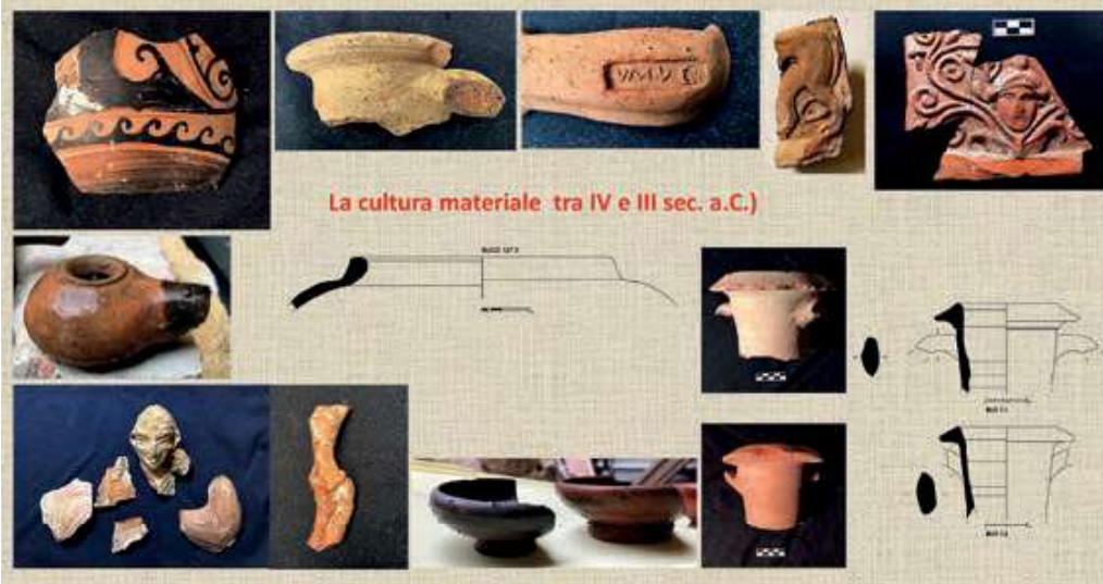
Cultura materiale dagli scavi nel rifugio antiaereo

vicini al Palazzo Santamarina (Palazzo Trabia e Palazzo Gualbes), di descrivere con maggiore precisione le vicende edilizie e le trasformazioni del paesaggio urbano medievale lungo il percorso delle fortificazioni. In questa sede ci soffermeremo sulle scoperte cronologicamente più antiche relative alla città punica.