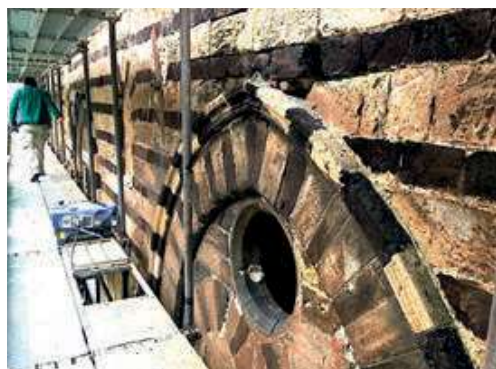
Facciata meridionale del Palazzo Santamarina in corso di restauro

Il palazzo, come si è visto nel corso del restauro, è frutto di un ampliamento e di una radicale riconfigurazione, con l'accorpamento di più immobili e la creazione dei due scaloni, avvenuta nel XVIII secolo, quando divenne proprietà della famiglia del marchese Galletti di Santamarina 1 ; in quest'occasione si rese necessario anche il consolidamento di alcune porzioni dell'edificio con pilastri, come nel caso dell'ambiente all'angolo sud-ovest, dove gli scavi ci hanno rivelato che nel Cinquecento doveva trovarsi un giardino ( hortus conclusus ). Sempre al XVIII secolo sembrano risalire le profonde modifiche delle quote stradali che si resero necessarie per raccordare la via del Celso con la via Maqueda, che correva a quota sensibilmente inferiore. A seguito di queste complesse trasformazioni, si è potuto accertare che gli ambienti, oggi al primo piano, nel Trecento dovevano trovarsi al piano terra o tutt'al più a piano rialzato, sicché lo scalone orientale,