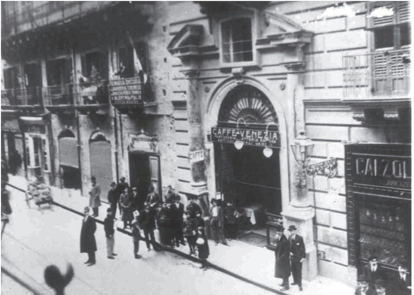
Caffè Venezia a palazzo Geraci (in A. Chirco, M. Diliberto, Il Cassaro di Palermo , Palermo 2017, p.68)

Tra la fine del XVIII e l'inizio del XIX secolo, la Grande Conversazione fu trasferita a palazzo Guggino, meglio noto come palazzo Bordonaro 6 da dove nel dicembre 1800 re Ferdinando di Borbone, in esilio in Sicilia, assistette con tutta la sua corte alla processione dell'Immacolata.